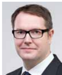
Alexander Schweitzer Gesundheitsminister Rheinland-Pfalz